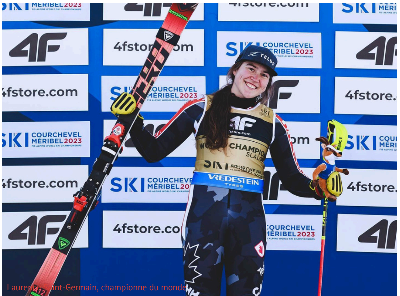
Laurence Saint-Germain, championne du monde